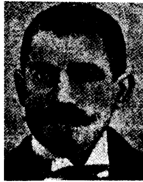
יוסף מרקו ברוך ועיתונו יכרמל

אפילו אנארכיסט, 15 ואף שלימים היתה לו, לברוך, עדנה אידיאולוגית, וכדיעבד הפכו אותו לאחד מאבות הציונות הרביזיוניסטית, 16 הרי לאמתו של דבר עודנו דמות עלומה. הוא נולד בקושטא בשנת 1872, ומסתבר שלפחות מצד אמו היה ממוצא אשכנזי, התחנך בבירות המערב וסיים את חוק לימודיו בפילוסופיה באוניברסיטה של ברן. 17 ובאגרונומיה באוניברסיטת מונפלייה, היה נודד בלתי-נלאה, דבק עד שיגעון ברעיון הלאום, ורומאנטיקן החדור אהבה ליהדות לעמו. 18 התלהבותו לא