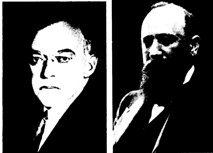
שניים מתוך המנהיגים והעסקנים הציוניים בעולם, שביקרו בקושטא קודם מלחמת-העולם הראשונה: יו"ר ההסתדרות הציונית העולמית (מימין), דוד וולפסון, וזאב ז'בוטינסקי

לא כל מי שהצטרפו לציונות עשו זאת מאותן סיבות. הציונות ניצלה לתועלתה את חוסר שביעות-הרצון של ההמונים, של חלקים מסוימים בשולי המעמד הבינוני, של כמה אינטלקטואלים ושל בעלי ההשכלה החלקית שהיו נתונים להשפעת המערב לאחר שהות קצרה במסגרת חינוכית במתכונת אירופית. כך ניתן להסביר את