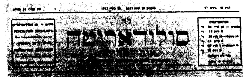
(למעלה): קבוצת סוציאליסטים יהודים בסאלוניקי, באחד במאי; (למטה): כותרת השבועון 'לה סולידאריותה אובראדירה' (האחוזה הפועלית), בטאון הפדראציה הסוציאליסטית של היהודים בסאלוניקי, הגיליון 25 ביוני 1912

והאינטלקטואלים, בפרט נוכח המאבק הגלוי שניהלה הפדראציה נגד הציונות. 30 לעומת זאת כ"ח נשען על הנכבדים המקומיים להגשמת מפעליו החינוכיים. 31 הוא קיווה לתרום באמצעות השכלה וחינוך בסגנון אירופי להתחדשות (רגנראציה) של המוני היהודים. אלא שהאידיאולוגיה שעמדה בבסיס פעולתו לא נחלה כל הצלחה בקרב התושבים הללו. מלבד זאת לא היו לכ"ח האמצעים להפיץ, בקנה-מידה רחב, אידיאולוגיה שתוכל לגייס המונים, והוא אף לא נטה לכך. התמערבות, השתלבות בארצות המושב, הפצת השפה הצרפתית והתרבות הצרפתית, רכישת