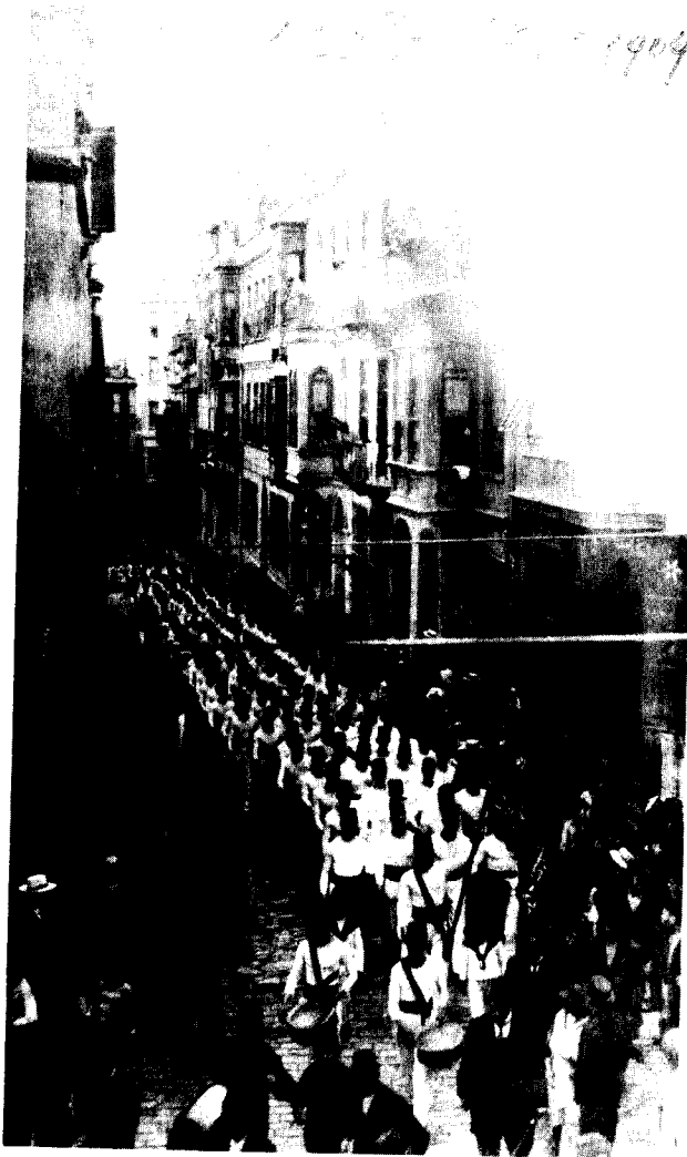
חברי 'מכבי' בקושטא בתהלוכה, שנת 1909, עם דגל האגודה ותזמורת

הציונות לא יכלה לתפקד באימפריה העות'מאנית אלא בלבוש של לאומיות יהודית, ויתכן שזו הסיבה לכך שהבט זה היה מכריע בפעילותה שם עד מלחמת-העולם הראשונה. הציונות כתנועה מאורגנת שאפה לרתום את היהדות העות'מאנית לשירות מטרותיה שלה. באופן דומה קבוצות מסוימות וכמה יחידים השתמשו במישור המקומי בציונות כדי להגיע לשלטון בקהילה, בלי שיטרחו ליישם את התוכנית הציונית שהטיפו לה. לגבי הרוב, מה שנשאר היה הלאומיות היהודית והתקווה הגלומה בה. הגבולות בין לאומיות זו לציונות 'חברתית' או 'תרבותית' לא הוגדרו בבהירות.