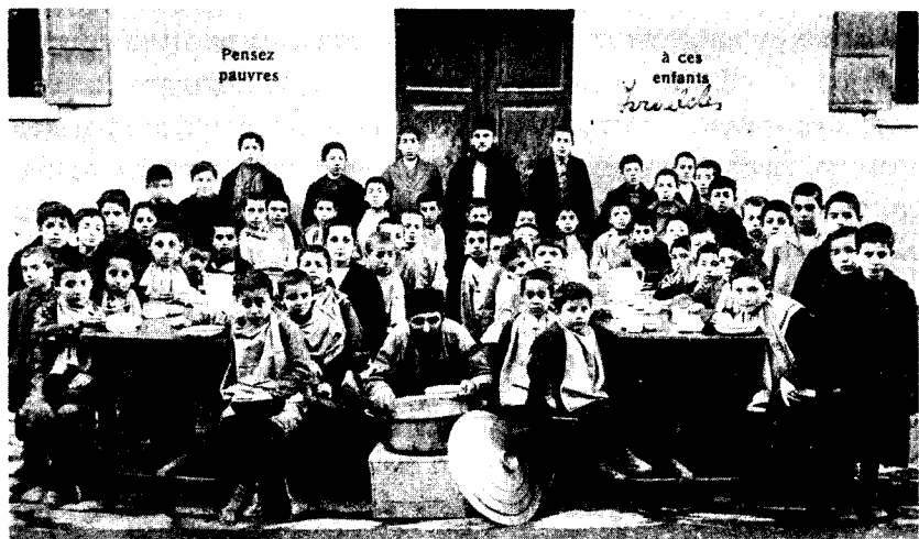
תלמידי בית-ספר כ"ח בסאלוניקי. על הקיר כתובת בצרפתית: חשבו על תלמידים עניים אלה