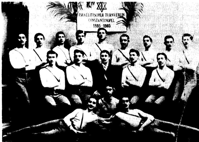
ארגון המתעמלים היהודים, קושטא 1895-1905, ממנו התפתחה מאוחר יותר הסתדרות 'מכבי' העולמית

היו אף נסיונות אחדים מצד הציונים לנטרל באמצעות תמיכות כספיות עיתונים אנטי-ציוניים, או עיתונים שהיו עלולים ליהפך לכאלה, כמו 'אל טיימפו' הקושטאי