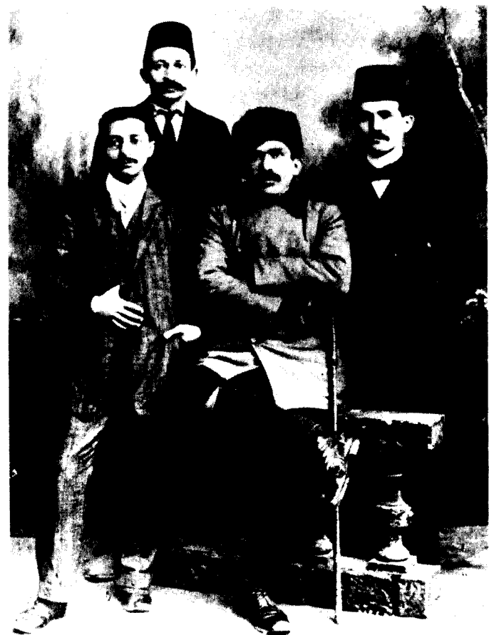
(מימין לשמאל): דוד בן-גוריון, ישראל שוחט, יצחק בן-צבי ויוסף טרומזה — בעת לימודיהם בקושטא, בשנת תרע"ג בקירוב

מהפכת 'התורכים הצעירים' ביולי 1908 נתפרשה בעיני הציונים כראשית תקופה חדשה. 10 הקמת נציגות של ההסתדרות הציונית העולמית בקושטא באותה שנה היתה צעד בכיוון של הסתגלות לנסיבות החדשות ועמדה בסימן של פתיחה מחדש במשא-ומתן עם השלטונות התורכיים על ארץ-ישראל. באותו זמן החליטו כמה עסקנים ציונים צעירים, וביניהם 'בן-צבי וד' בן-גוריון, ללמוד את השפה התורכית ולהמשיך בלימודיהם בכירה העות'מאנית. 11