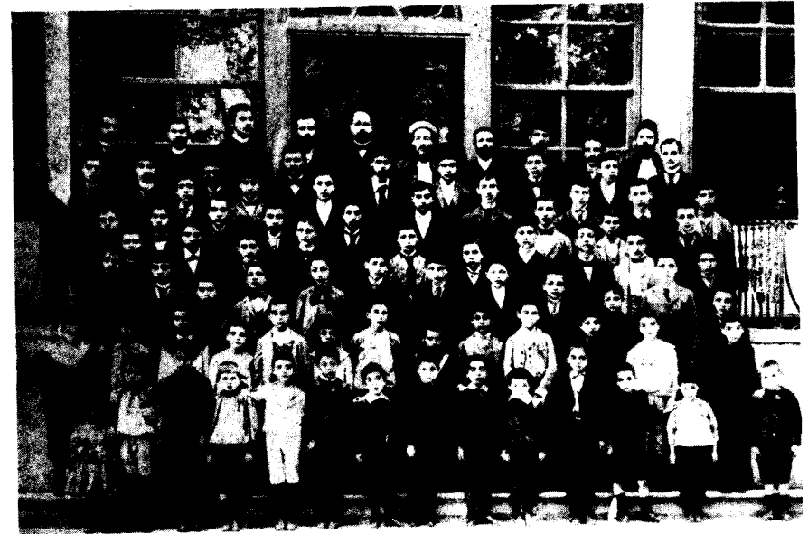
בית ספר "אליאנס" בשלוניקי, לפני 1917.

כ"ח לא היתה קבוצת הלחץ היחידה שחדרה לקיסרות. אליה יש להוסיף את חברת העזרה ליהודי גרמניה (Hilfsverein der Deutschen Juden), שנוסדה ב-1901 על-ידי יהדות גרמניה וחתרה להשיג אותן מטרות כמו כ"ח, אך דאגה מצידה לטפח את השליחות הציוויליזטורית הגרמנית, את הציונות ואת 'בני ברית'. בהתחשב במקומה של כ"ח על לוח השחמט הקהילתי, מתייצבים שותפים חדשים אלה, בתורם, כקבוצות לחץ. היהודים המקומיים משתמשים בהם לצורכיהם שלהם. מאבקי הכוח שלהם — בהקשר המצומצם של הקהילה המייצגת את המרחב היחיד שבו יכול היה יהודי עות'מני להיות בעל אחריות ציבורית — נעשים חריפים, מה גם שהשיטה הפוליטית הקהילתית היא אוליגרכית, ואין אפשרות של חלוקת עוצמה. להיות בעל עמדה על לוח השחמט הפוליטי של הקהילה פירושו בעת ובעונה אחת גם טפס בסולם החברתי. מספר המקומות מועט ומספר המועמדים הוא רב. עם